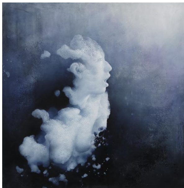
西田弘英「Aphros series light and age」2012年 800×800 mm