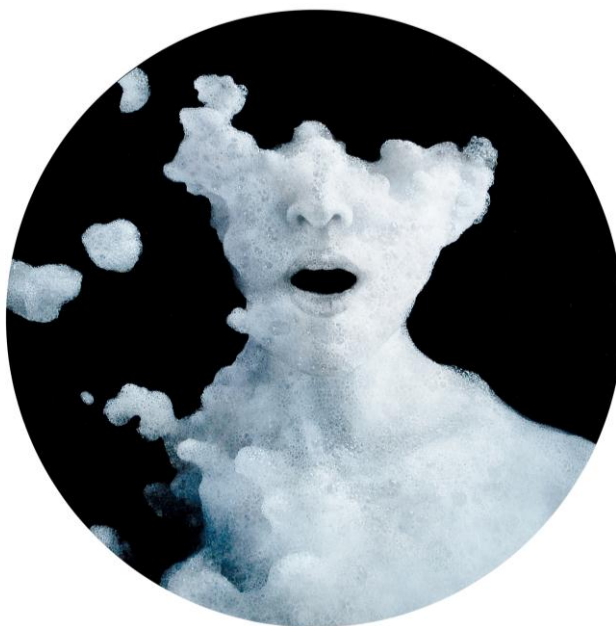
西田弘英 Kohei Nishida 「song」2012年 φ290mm

アトリウムのアート展示は、『ART colours（アートカラース）・汐留で日本に染まる』をコンセプトに、心が満たされるひとときをパークホテル東京は日本の美意識（＝おもてなし）でご提供いたします。