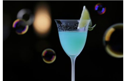
カクテル 「しゃぼん玉」