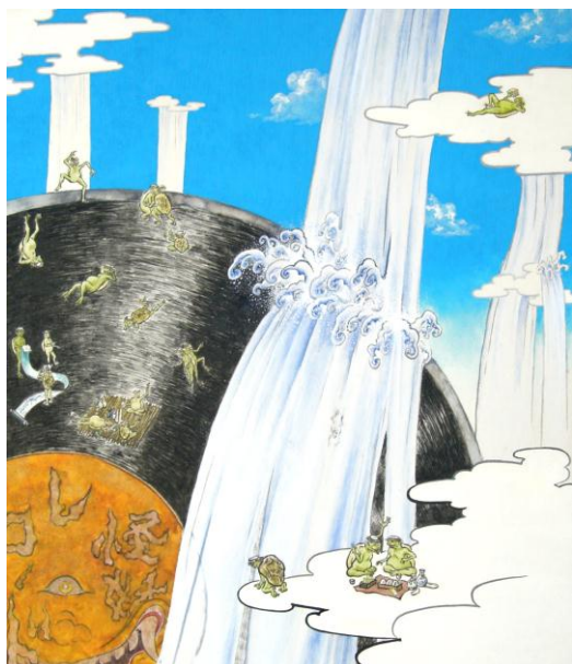
馬籠伸郎「水の国」2009年 530×455 mm

日本の夏の遊びに「肝だめし」というものがあります。昔から“背筋が凍る”、“肝を冷やす”など、驚いて震えたり、ひんやりしたりする様子を示す言葉があり、暑さをしのぐ娯楽として、怖い話やお芝居を見聞きして、涼しさを感じていたようです。中でも『妖怪-YOKAI-』は、人の知恵では理解できない不思議な現象や不気味な化け物として知られています。人を驚かしたり、いたずらをしたり、災いを起こすものとして恐れられていますが、ときに妖怪は、神と対になった存在でもあり必ずしも善悪で分けられない化身として、口伝えや、民話、漫画などに登場し、日本人にとって馴染みのある夏の風物です。今回のART coloursでは、江戸時代に描かれた化け物、現代作家西田弘英さんの、手描きとは思えないほど細かな泡で表現された女性像や、江本創さんが制作した妖怪のミイラなど、妖しいもの、儚いもの、楽しいもの、今までにない妖怪も発見できるかもしれません。人の目では見ることのできない姿を描いた作品たちを是非ご覧下さい。