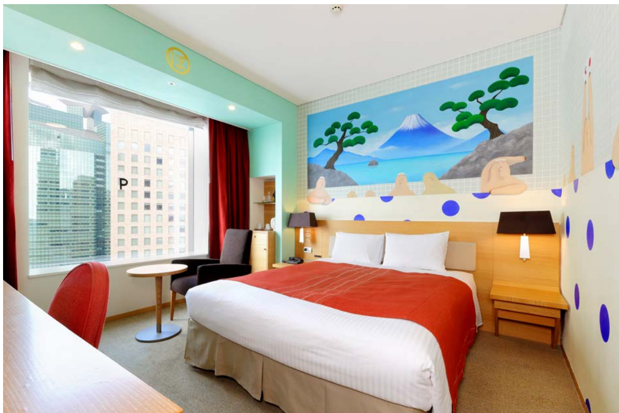
アーティストルーム 銭湯 内観

なんとも不思議な、泊まれるアート「アーティストルーム 銭湯」に、ぜひお越しください。