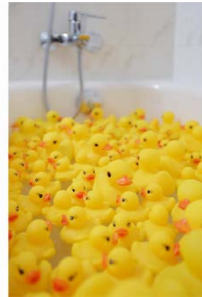
お風呂にはアヒルもあるので 浮かべて遊ぶこともできる