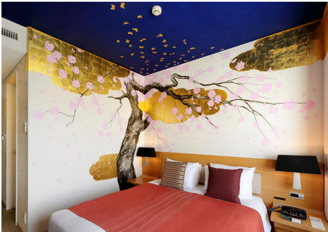
アーティストルーム 桜 内観

桜の散り際に込められた、日本人の美意識をアーティストルーム「桜」で、どうぞご覧ください。