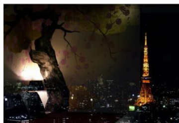
窓に映り込んだ桜と、東京タワー