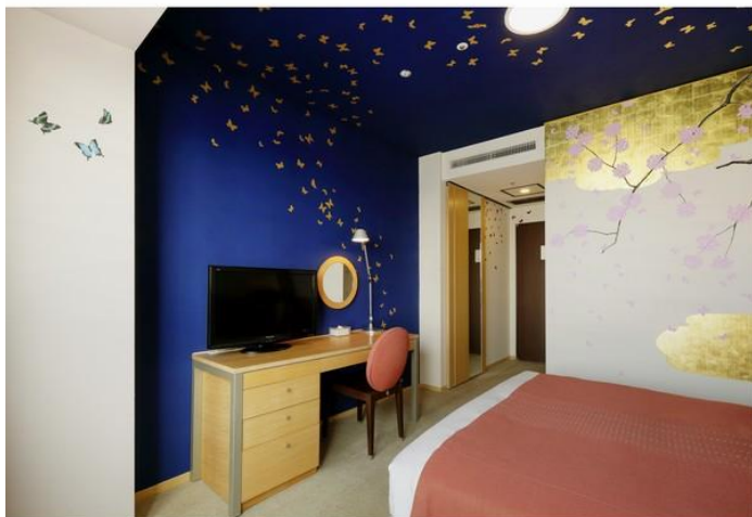
深い青で塗られた天井には金色の蝶が舞う

【協力】：不忍画廊 【総合プロデュース】：プロデュース：ART FACTORY'S 粋、creative unit moon ( http://www.moooon.jp )