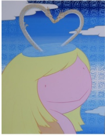
L and L

馬籠伸郎 まごめのぶお / 1976 年東京都生れ。多摩美術大学大学院日本画専攻修了。「日仏現代国際美術展」、YOKAI TOUR (パークホテル東京)、International Contemporary Art fair(バルセロナ)、国際インパクトアートフェス(京都市美術館)、「人人展」(東京都美術館)