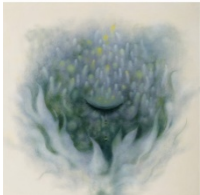
portrait of forest b

會田千夏 あいたちなつ / 1980年札幌市生れ、札幌大谷短期大学油彩卒、多摩美術大学大学院修了、全道展《最高賞》最年少で受賞、個展「snow white」（不忍画廊）、「VOCA展 2007」（上野の森美術館）、「A☆MUSE☆LAND☆2007…小林孝旦、名和晃平他」（北海道立近代美術館）、札幌国際芸術祭「スプラウト！」（佐藤忠良こどもアトリエでの個展）