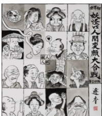
妖怪 VS 人間変顔大合戦

逢香 おうか / 1994年大阪府岸和田生れ、全日本高校大学書道展、日本の書展、日本学展等、「書」で受賞歴多数。「妖怪画パフォーマンス」。