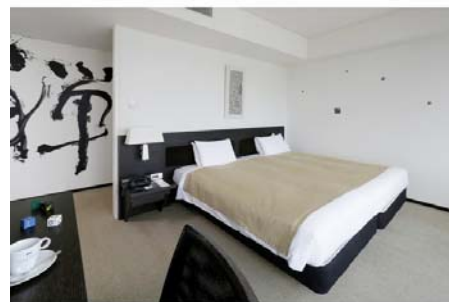
アーティストルーム 禅

【総合プロデュース】：creative unit moon ( http://www.moooon.jp )