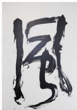
「禅」と「風」は居合い抜きのように一気に書かれた その様子は動画にて近日公開予定