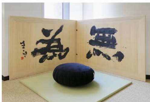
座禅をしていただくスペース 風炉先屏風は桐製