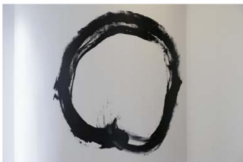
丸い柱に揮毫された円相