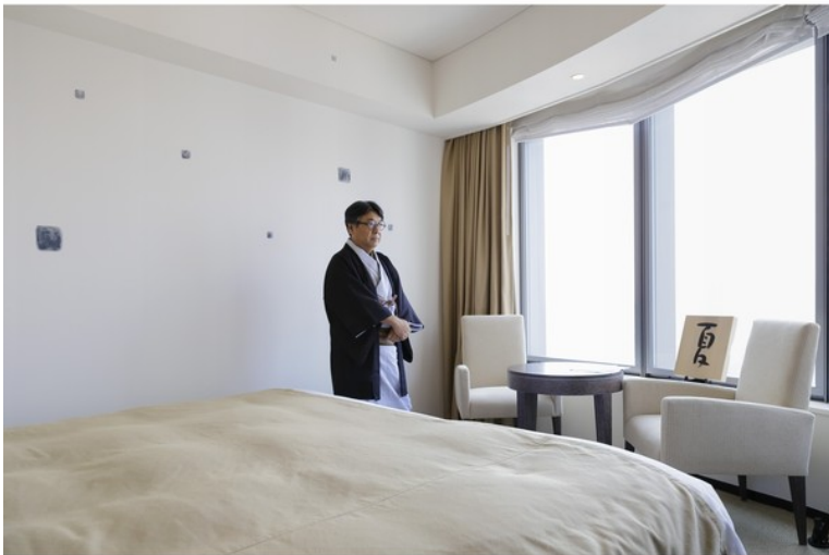
秋葉生白氏。お部屋は「静」と「動」のスペースに分かれる 写真は「静」