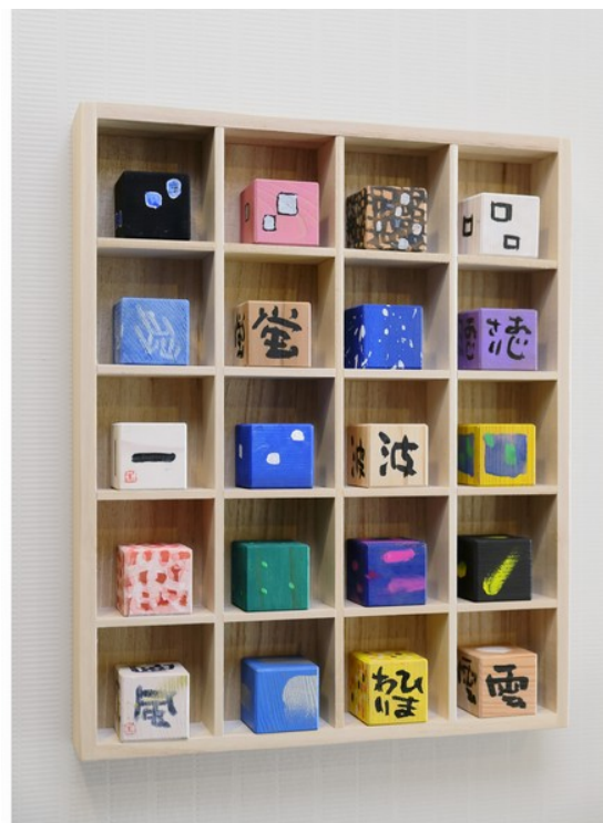
手のひらサイズの桐箱に描かれた、季節の文字