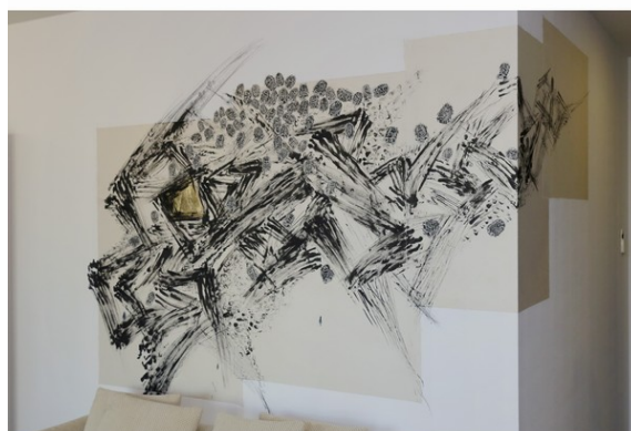
「風神」と「雷神」をイメージして、壁に直接手で描いた作品。小さな神様が貼り付けてある