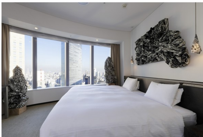
大きな窓から広がるシティービュー