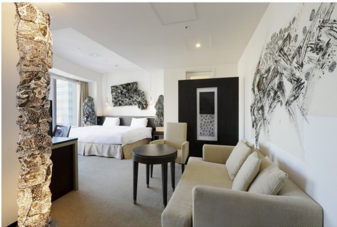
お部屋の内観 入り口付近より