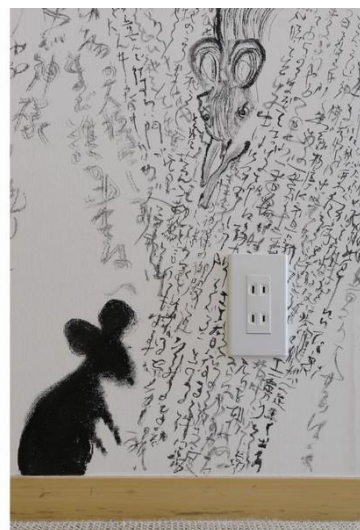
「子」からスタートして、12種類の動物が描かれている。