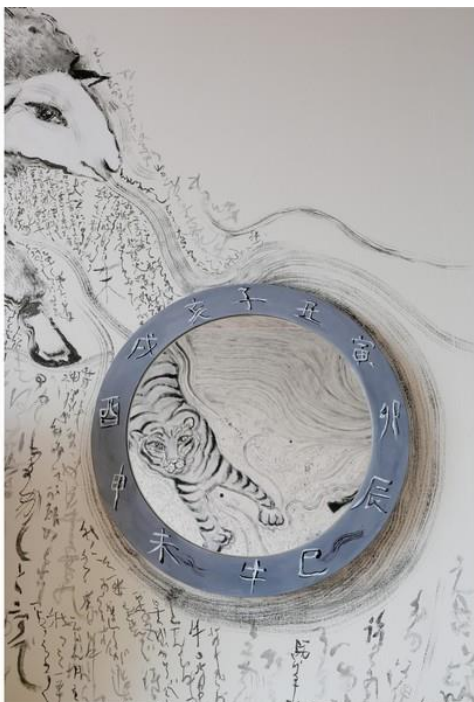
ベッドに横たわると、鏡に映った虎と目が合う