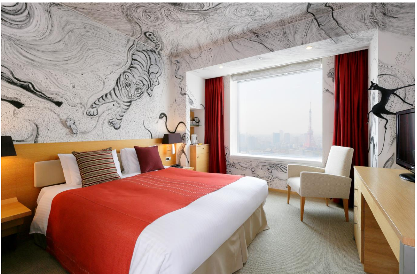
アーティストルーム 十二支 内観

「アーティストルーム 十二支 Zodiac」に、皆様お誘いあわせの上、ぜひお越しください。