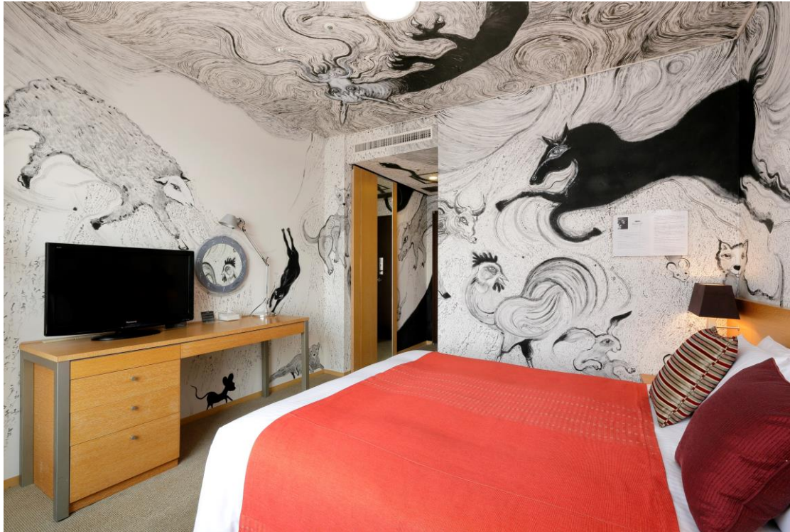
窓側からみたお部屋 天井には「辰」が。

【総合プロデュース】：creative unit moon ( http://www.moooon.jp )