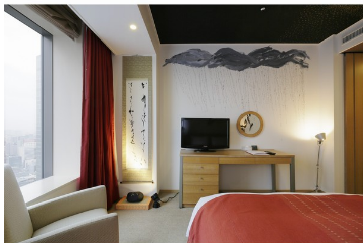
壁面の雨も百人一首 右から順番に百首、書いた