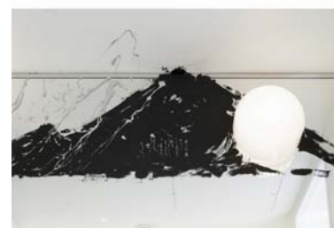
バスルームには「富士の高嶺に…」の歌が