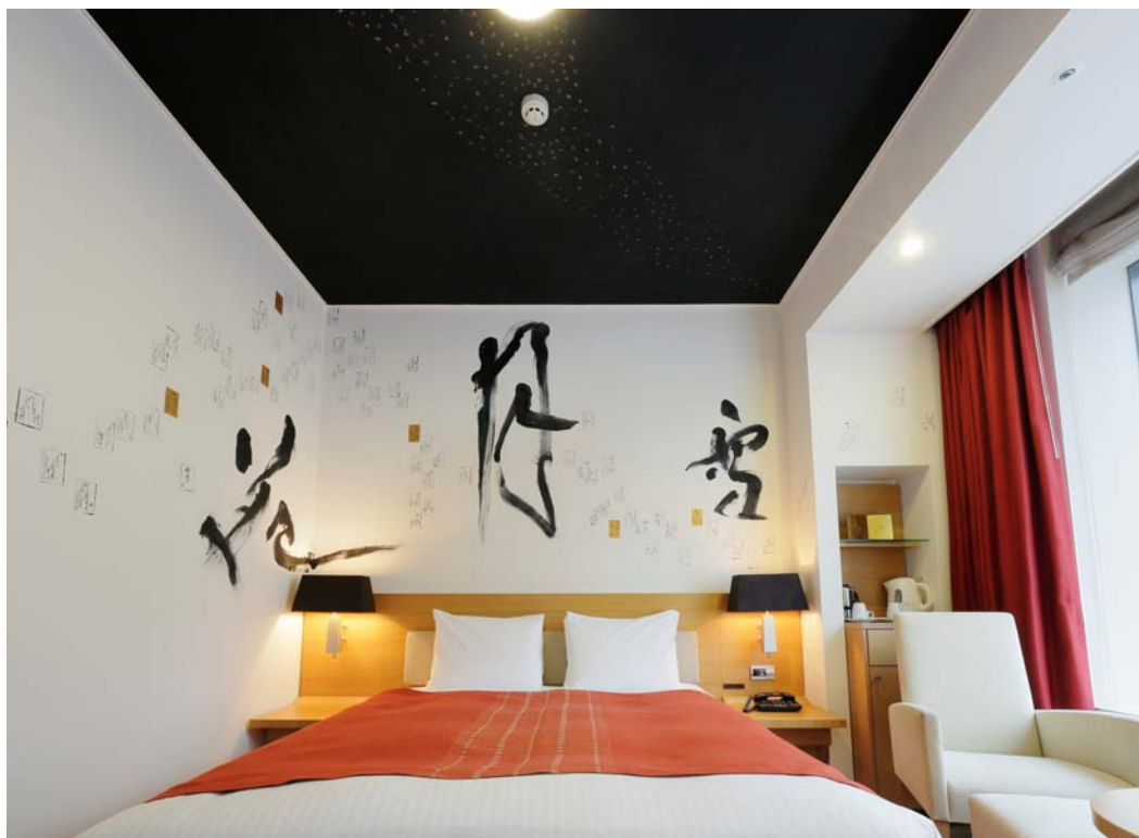
アーティストルーム百人一首 内観