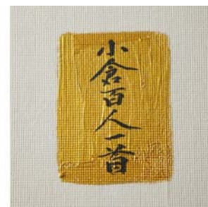
かるたのように、四角の中に書き込んだ

【総合プロデュース】：creative unit moon ( http://www.moooon.jp )