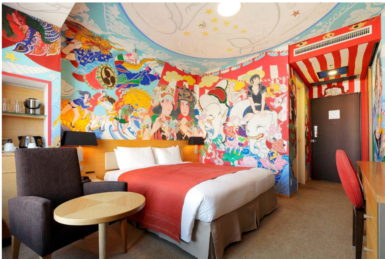
アーティストルーム 祭り 内観

この部屋を訪れる人が、元気になりますように！という願いを込めて描きました。 「アーティストルーム 祭り」に、皆様お誘いあわせの上、ぜひお越しください。