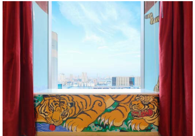
窓を開けると東京湾が見える