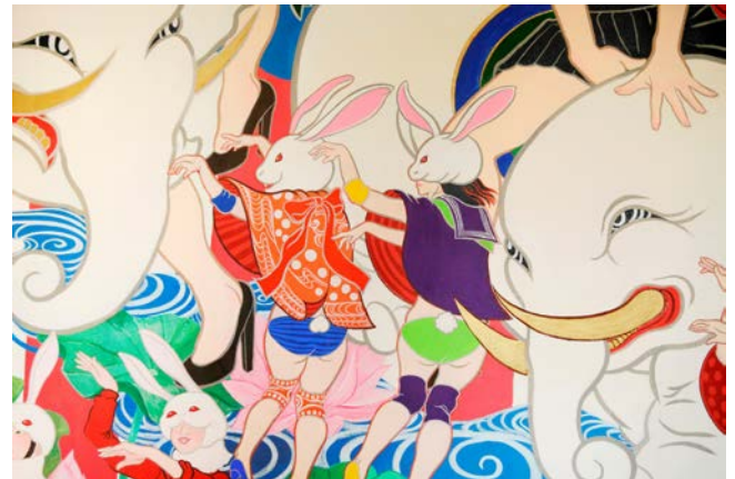
ウサギの扮装で、踊る女性たち