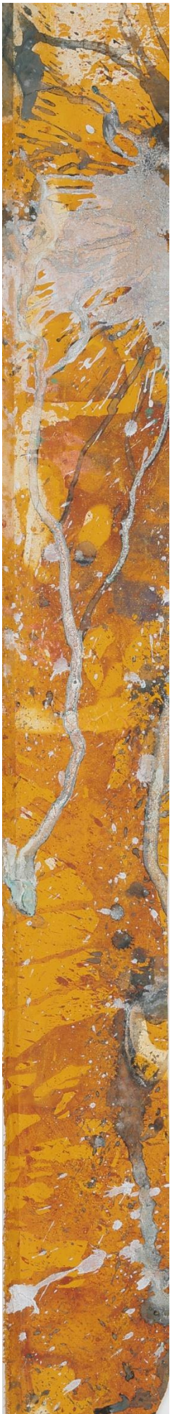
「大きな豊かな流れ」