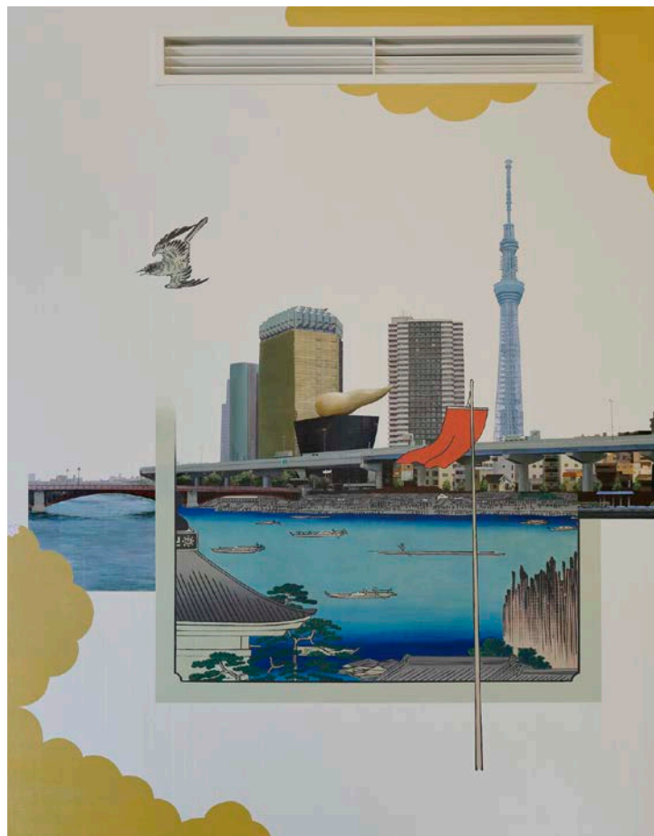
広重の残した江戸の風景と見慣れた現代の東京の景色を重ねた絵