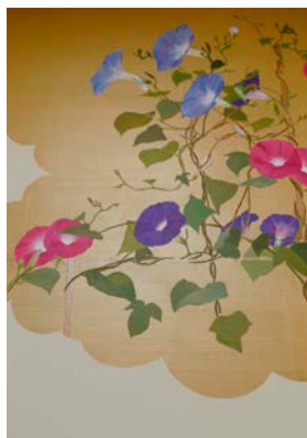
金地に栄える朝顔