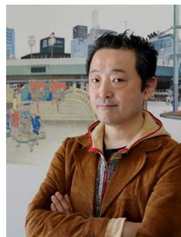
ふるかはさん近影