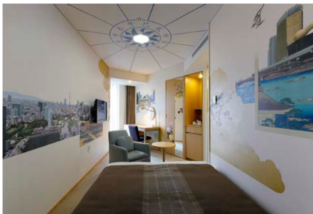
実際の方角に描かれたランドマーク