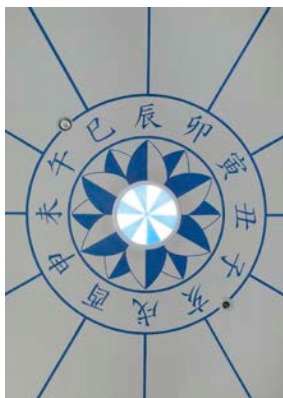
天井に記された方位マーク

【協力】不忍画廊、AIN SOPH DISPATCH【総合プロデュース】creative unit moon