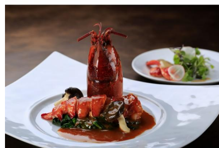
「オマールのアメリカーナ風」

琳派の風神雷神図をモチーフに、赤と緑の色鮮やかなお料理ができあがりしました。クラシックなオマール海老料理をどうぞご堪能ください。