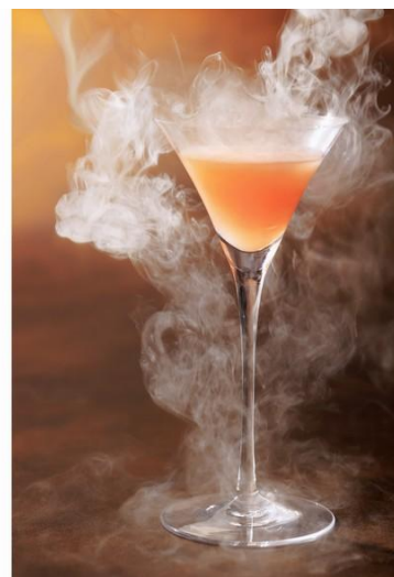
「ファースト スプリング ストーム」