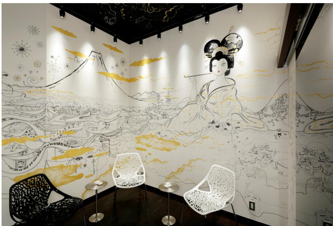
喫煙スペース TOKYO マロン 内観

国際都市 TOKYO から見える日本の象徴、富士山とワンセットなのはやっぱり GEISHA！！優雅に横たわる巨大なマロン太夫（たゆう）の手にした煙管からただよう金色の雲から垣間見えるのは、現代を象徴する東京スカイツリー（R）と東京タワー、空飛ぶお寿司やラーメンガール！？、懐かしいカンカンの踊り子にゴジラに謎の UFO、歩き回る猫と無数のエロかわキュートな女性たち。ビジネスタウン汐留にあるホテルの小さな喫煙スペースが、大人のための大切な一休み「一服」の時間を遊び心と共に楽しく、そしてクリエイティブに過ごすお部屋となります。壁一杯に俯瞰で描かれたカオスの魅力溢れるイリュージョンな東京の街を、実際に鳥の目のように見下ろす立地にあるホテルの25Fからイメージトリップを楽しんでいただける、そんな喫煙スペース「TOKYOマロン」にぜひお立ち寄りください。