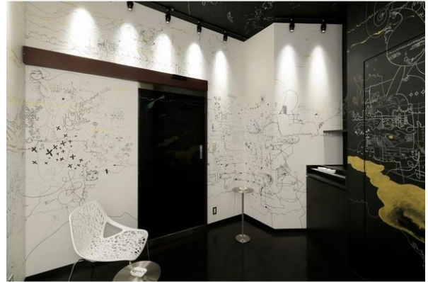
天井から壁までいっぱい広がる架空の街