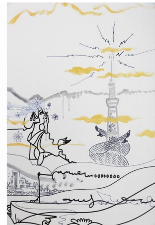
何かを出している、東京スカイツリー (R)