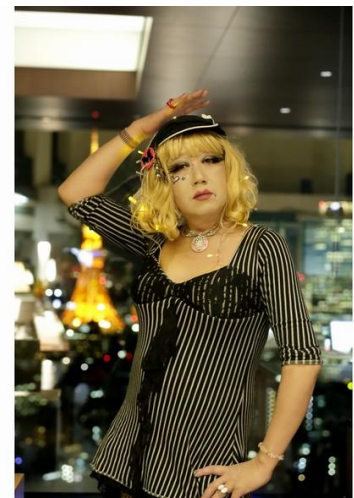
マロンちゃん近影