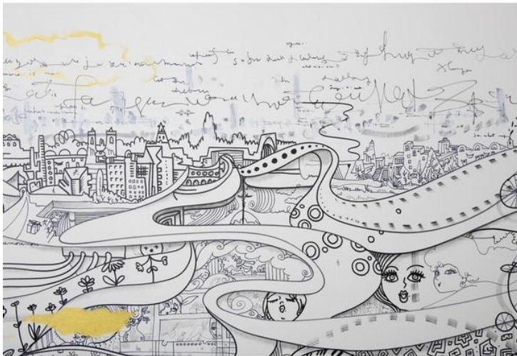
エロかわキュートな女性たちは、マロンちゃんの化身??