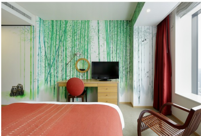
反対側の壁にも、広がる竹

【協力】：羽黒洞 Hagurodo ( http://www.hagurodo.jp ) 【総合プロデュース】：creative unit moon ( http://www.moooon.jp )