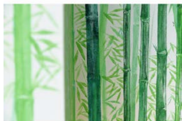
一番竹が生い茂っている時の緑をイメージ