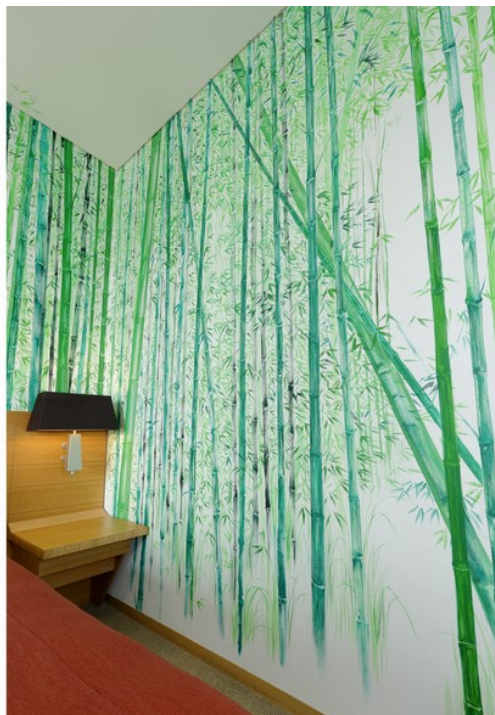
竹林の奥に、小道が見える