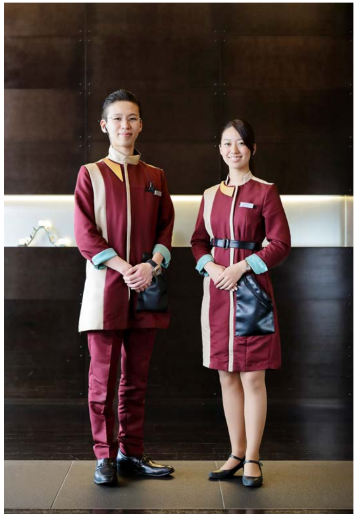
スタッフ ユニフォーム

中里さんは2014年には実写版映画ルパン三世の衣装クリエイティブディレクションを担当したほか、EXILEやレディー・ガガの衣装デザインも手がけるなど、その洋服は国内外のアーティストに愛用されています。