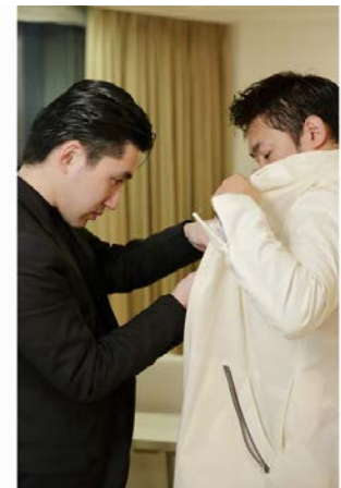
フィッティング風景 1