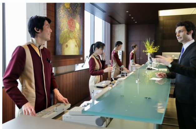
フロントスタッフ