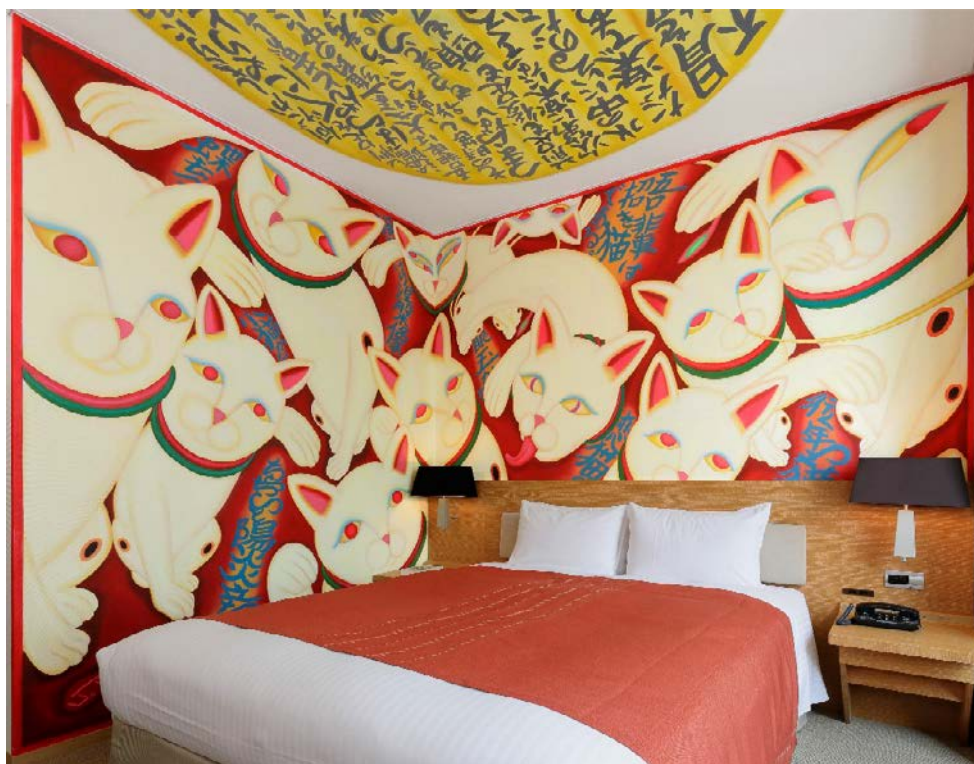
アーティストルーム 招き猫 内観