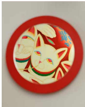
ベットから覗く鏡の中にも招き猫