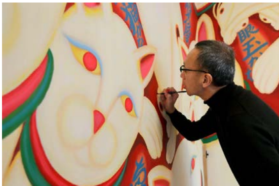
制作中の美濃さん