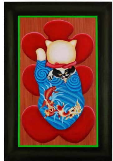
枕屏風の反対の壁に描かれた大入額 国芳「金魚づくし」をモデルに