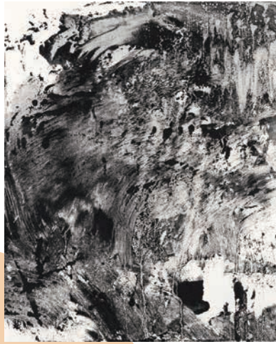
Naoto Sunohara 春原直人