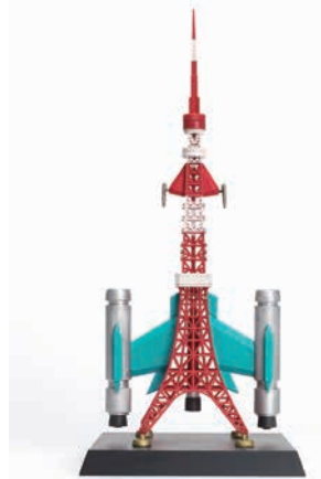
Bunpei Kado 角文平