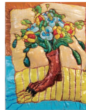
Yume Aoyama 青山夢