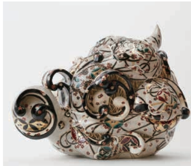
Kasumi Ueba 植葉香澄