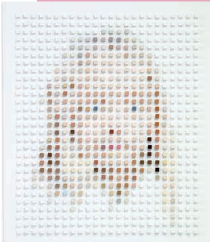
Takeshi Abe 阿部岳史