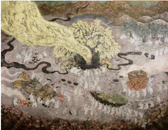
Nozomi Tanaka 田中望